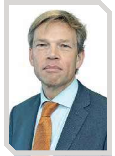
JOEP WIJNANDS Hollanda Krallığı Ankara Büyükelçisi

Hollanda ile Türkiye, döngüsel ekonomi ve tarım sektörünün yanı sıra teknoloji ve inovasyon alanında güçlü bir diyaloga ve iş birliğine sahip. Döngüsel tekstil konusunda devam eden yakın diyalogun sonuçları somutlaşmaya başladı. Bakan Klever'in geçen ocak ayında Türkiye'ye gerçekleştirdiği ziyaret sırasında, Hollandalı BaWear firması ile Türk Orbit Consulting firması, tekstilde tedarik zincirlerini dijitalleştirerek döngüsel tekstil uygulamalarını desteklemek amacıyla bir ortaklığa imza attı.