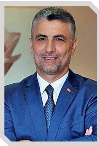
ÖMER BOLAT Türkiye Cumhuriyeti Ticaret Bakanı

Hollanda, Türkiye'nin en büyük doğrudan yatırımcısıdır. Yasal altyapımız, ülkelerimiz arasında 1989 yılında imzalanan Çifte Vergilerin Önlenmesi (ÇVÖA) ve Yatırımların Karşılıklı Teşviki ve Korunması (YTKK) Anlaşmalarına dayanmaktadır.