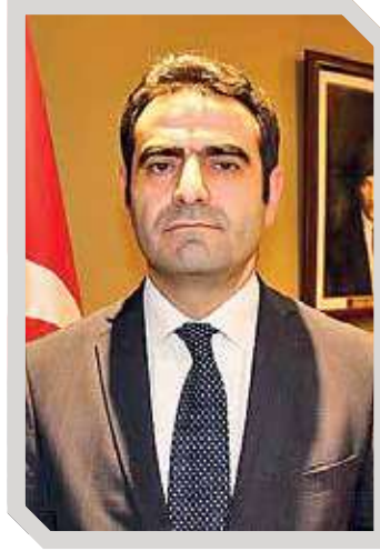
SELÇUK ÜNAL Türkiye Cumhuriyeti Lahey Büyükelçisi

1964 yılında Hollanda'ya Türkiye'den işçi göçüyle başlayan işgücü değişimi aradan geçen 60 senede Hollanda'nın ekonomik gelişimine önemli katkı sağlamıştır. Bu süreçte, yarım milyondan fazla bir nüfusa ulaşan ve dördüncü nesline erişen Hollanda-Türk toplumu niteliksel olarak daha katma değerli işlerde ekonomiye katkı sağlamaya başlamıştır. Birçok insanımız bugün işveren olmuştur. Uluslararası nitelikteki şirketlerin de aralarında bulunduğu, çoğu küçük