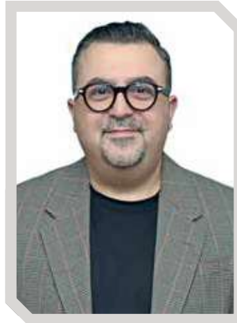
NACİ EROĞLU ETB Group CEO'su

rini daha etkili ve verimli hale getirmek için en üst düzeyde kullanmayı hedeflediklerini bildiren Naci Eroğlu şu ifadeleri kullandı: "Yapay zeka (AI), otomasyon ve veri analitiği gibi teknolojik çözümlerle süreçleri hızlandırarak, müşteri deneyimini önemli ölçüde iyileştirmeyi amaçlıyoruz. Ancak, ETB olarak inanıyoruz ki, teknoloji yalnızca destekleyici bir rol oynamalı ve asla insan faktörünü ikame etmemelidir. AI, belli görevleri devralabilir ve süreçleri hızlandırabilir, ancak müşteri ile kurulan empatik ve insani iletişim her zaman merkezde kalacaktır. Yapay zeka çok güçlü bir araç olabilir, ancak empati ve nuance, bu süreçlerin ayrılmaz bir parçasıdır. Teknolojiyi kullanarak hem çalışanlarımızı hem de müşterilerimizi daha iyi anlayabiliyoruz, ancak asıl amacımız, insan faktörünü azaltmak değil, müşteri hizmetlerindeki insani dokunuşu koruyarak verimliliği artırmaktır. Bu yaklaşım, ETB'nin sektördeki yenilikçi ve insana değer veren duruşunu pekiştiriyor"